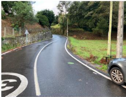
Zona y vivienda afectadas